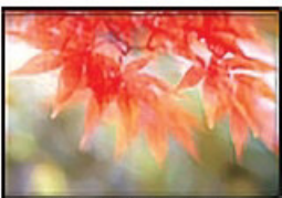
風に揺れるもみぢ 新宿御苑

それは音楽でも同じなのだそうです。音楽も写真も、美しいものは心を牽せに、温かくしてくれます。これからも私は自然風景を色彩豊かな作品にしていきたいのです。長姐には「菊々とした」私が！そしてこれからも…。